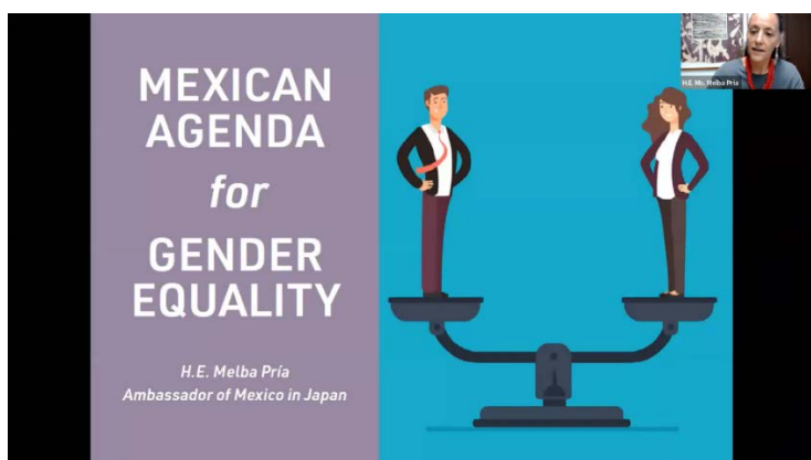
(オンラインでの GRIPS Forum の様子)